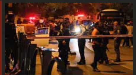
זירת הפיגוע באלעד

19 אזרחים ישראליים נרצחו בפיגועים מתחילת 2022, 11 מתוכם נרצחו על ידי מחבלים מנפת ג'נין.