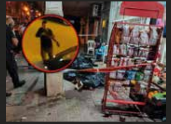
זירת הפיגוע בבני ברק

ו' בניסן תשפ"ב, 7 באפריל – הפיגוע בדיזינגוף