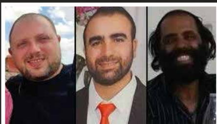
שלושת הנרצחים בפיגוע באלעד