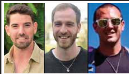
שלושת הנרצחים בפיגוע בדיזינגוף, תל אביב

ו' בניסן תשפ"ב, 7 באפריל – הפיגוע בדיזינגוף