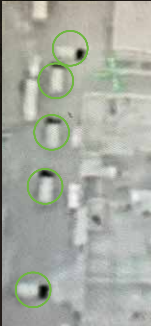
תצלום אווירי של כלי הרכב הצה"ליים בנקודה